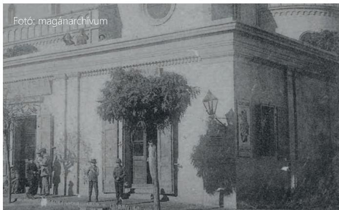
19. századi utcai petróleumlámpák a Bazársor végén

A világításra a rendőri adót használták fel, amelynek megfizetését kiterjesztették a préház-