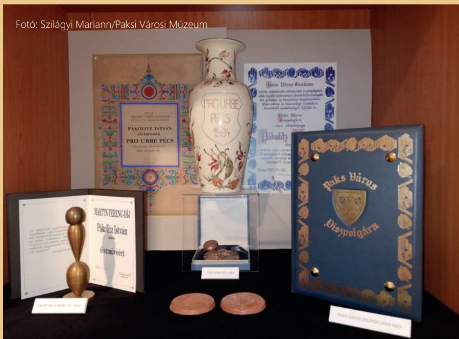
A paksi költő díjainak egy része a Paksi Városi Múzeum Pákolitz-emlékszobájában.