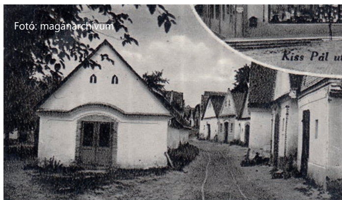
Képeslapprészlet: Sárgödör téri préházor, (Kiss Pál Utóda kiadása, kb. 1940)

„A préházak főhomlokzata, néhány kivételtől eltekintve, az épü-